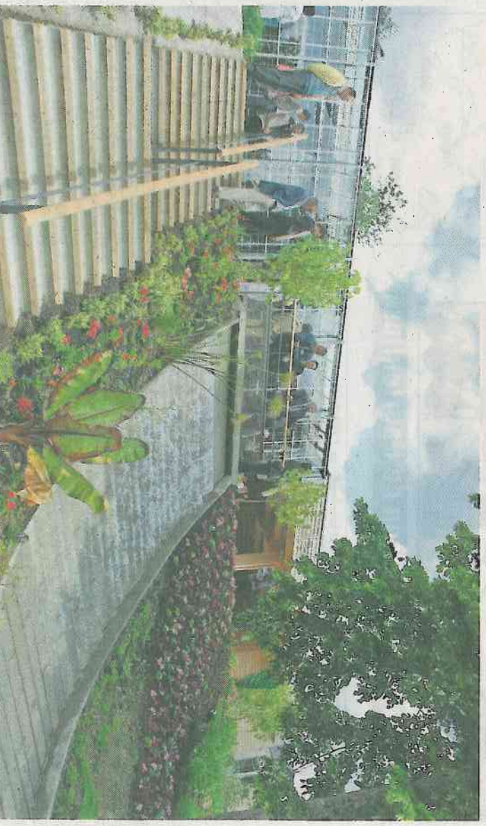
Carnifolia présente un jardin de près de 3 hectares, une serre de 190 m 2 , deux salles d'animation de 50 m 2 , un espace scénographique, une boutique, une terrasse et un coin restauration légère.

Renseignements-inscriptions : Maison de quartier, tél. 02 41 43 28 13 ; site : www.letoutpourletout.org .