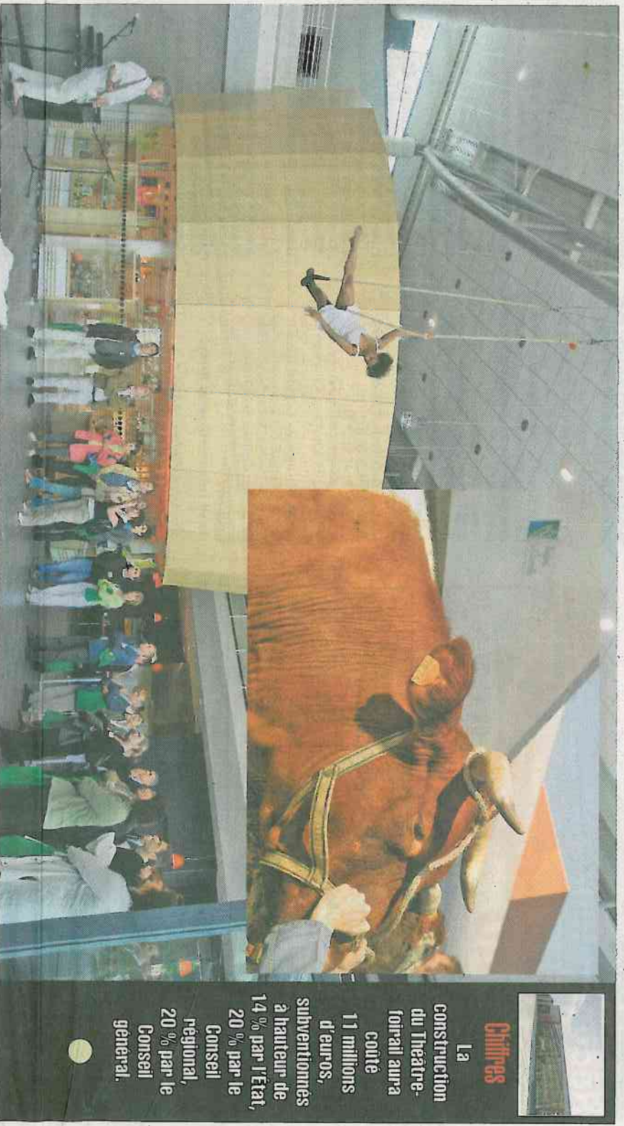
Le Théâtre-foirail et ses grands espaces (ici le hall d'entrée et la boutique) se prêtent bien aux arts du cirque. Il accueillera du 5 au 7 septembre le Festival départemental de l'élevage et le concours national rouge des prés.

L'extérieur est également aménageable grâce aux 3 600 mètres carrés de chapiteaux dont dispose la Communauté de communes. Cela, c'est pour le côté culturel, événementiel, et