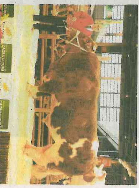
Ubin, le champion mâle, à Etienne Chesneau (Maine-et-Loire).