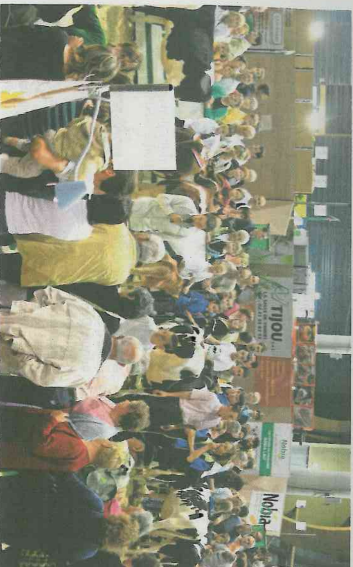
Le dimanche, place aux animations grand public, comme la présentation de génisses par les enfants et aux défilés des championnes.