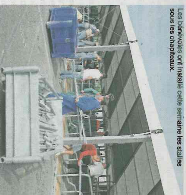
Les bénévoles ont installé cette semaine les stalles sous les chapiteaux.

Lire aussi notre dossier spécial pages 13 à 24.