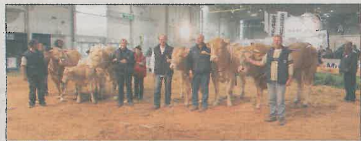
Le concours des Blondes d'Aquitaine a rassemblé, pour la première édition d'AgriMAX, vingt et un animaux provenant de huit élevages des départements de Côte-d'Or, Meuse, Meurthe-et-Moselle et Moselle.