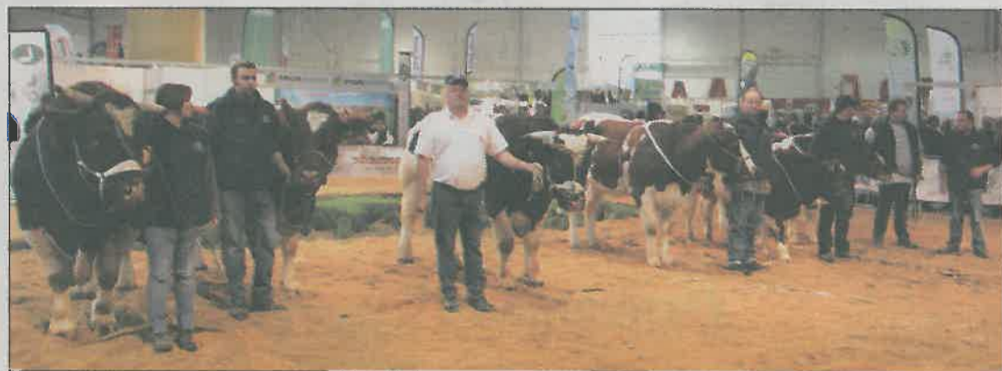
Sept éleveurs de Moselle et du Bas-Rhin sont venus à Metz, mettant trente-trois animaux en concours pour la race Rouge des Prés.