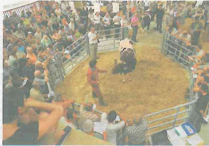
Pendant une après-midi, le Chaudron n'était pas à Saint-Etienne, mais au Domaine des Rues, à Chenillé-Changé.

La station avait aligné plus de taureaux qu'à l'accoutumée (32), mais le volume d'activité n'a pas changé (21 vendus). Cette option ne sera donc pas forcément à renouveler. La moyenne des ventes s'élève à près de 2 700 euros. L'animal le plus cher est parti à 3 700 euros. Il s'agit de Flaneur, issu de l'EARL Vaubernier-Joyau